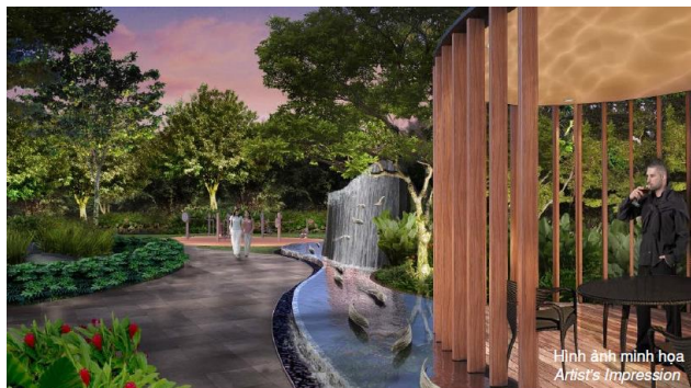
Hình ảnh minh họa Artist's Impression