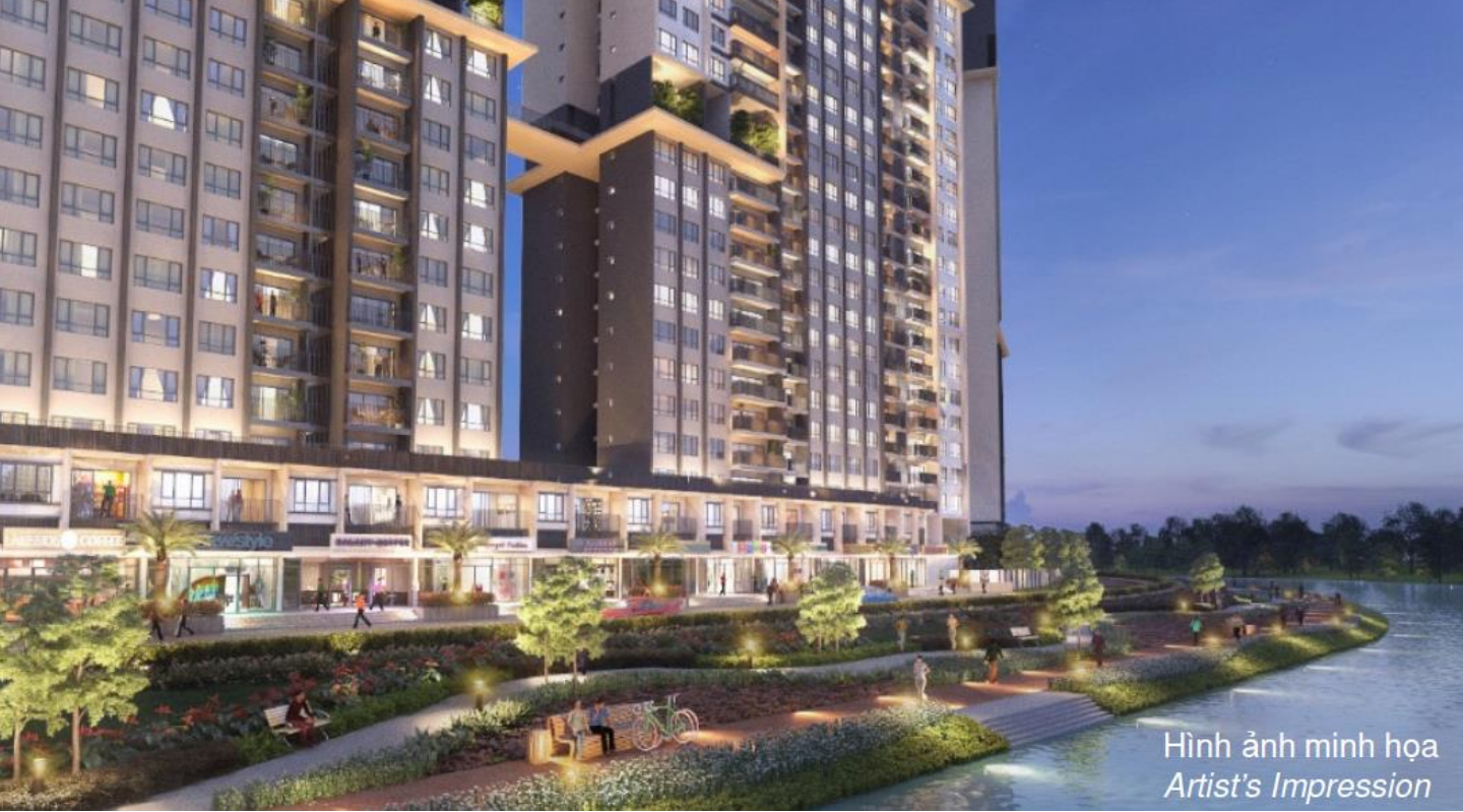
Hình ảnh minh họa Artist's Impression